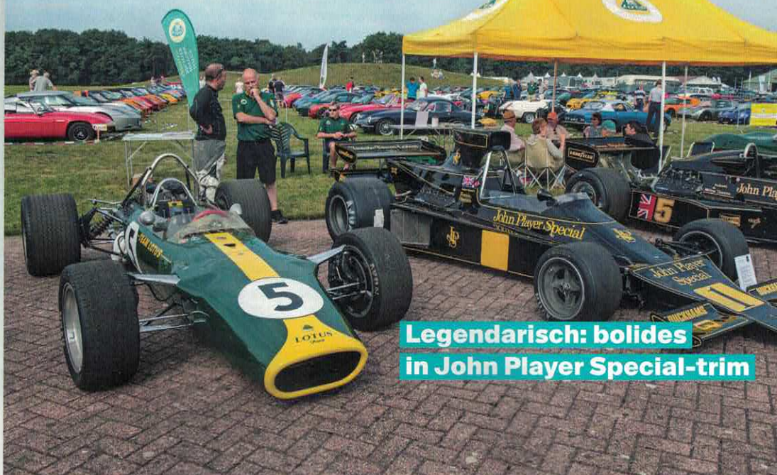
Legendarisch: bolides in John Player Special-trim

▼ Wat een schitterend Lotus-plaatje! Op de voorgrond de Formule 1-Lotus 49 met startnummer 5, die beschikt over een Cosworth DFV-motor. Bij zijn eerste optreden op Zandvoort in 1967 won de auto meteen de race. Op de achtergrond een veld vol straat-Lotussen.