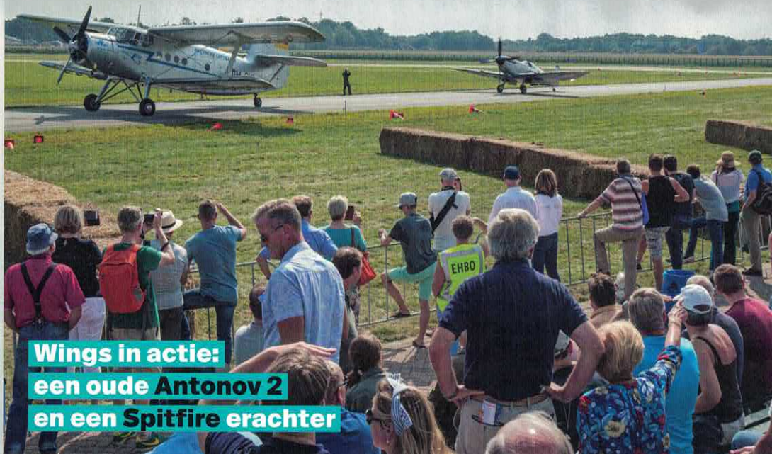
Wings in actie: een oude Antonov 2 en een Spitfire erachter