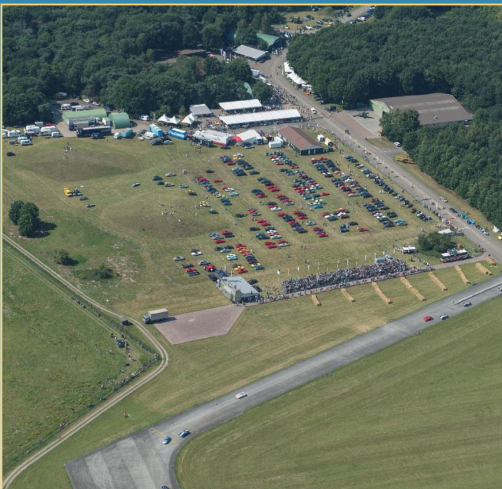
Classic Wings & Wheels evenemententerrein

De militair Vliegbasis Gilze Rijen is voor één dag omgetoverd tot het unieke evenemententerrein van Classic Wings & Wheels.