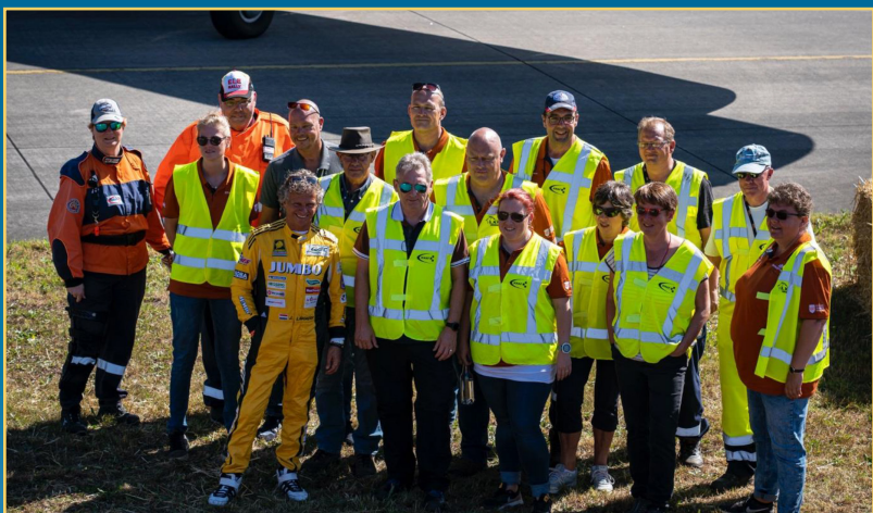
Jan Lammers, ambassadeur ZZF Fonds met een groep vrijwilligers.