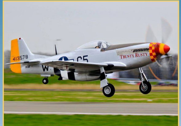
P-51 Mustang van de Stichting Vroege Vogels.