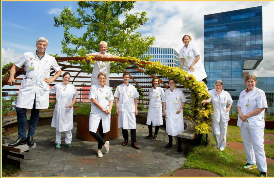
Het Team van het SLMK

Het Slokdarm- en maagkanker fonds is een van onze goede doelen. Het Fonds financiert onderzoek zodat de behandeling van slokdarmkanker kan verbeteren. Dit geldt voor zowel de operatieve behandelingen als het verbeteren van de postoperatieve kwaliteit van leven. Omdat veel reguliere fondsen hun gelden steken in aandoeningen die meer voorkomen en steeds minder overheidsgeld beschikbaar is, is het steeds lastiger om voldoende fondsen te werven om onderzoek te doen naar deze ernstige ziekte.